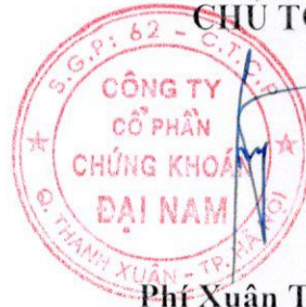
Phí Xuân Trường